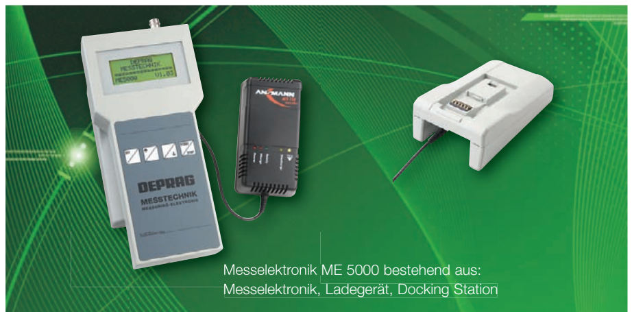
Messelektronik ME 5000 bestehend aus: Messelektronik, Ladegerät, Docking Station