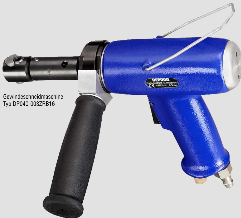
Gewindeschneidmaschine Typ DP040-003ZRB16