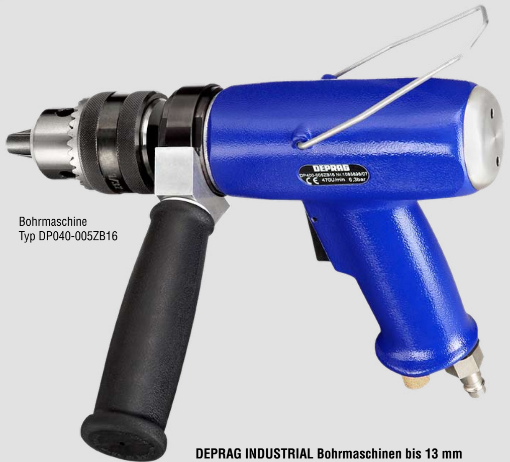
Bohrmaschine Typ DP040-005ZB16

Druckluft-Bohrmaschinen Pistolengriff mit Bohrfutter Leistung: 170 W, 290 W und 400 W