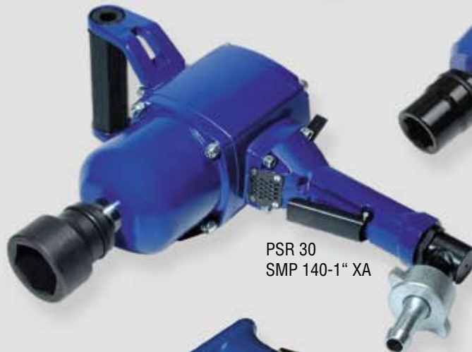
PSR 30 SMP 140-1" XA